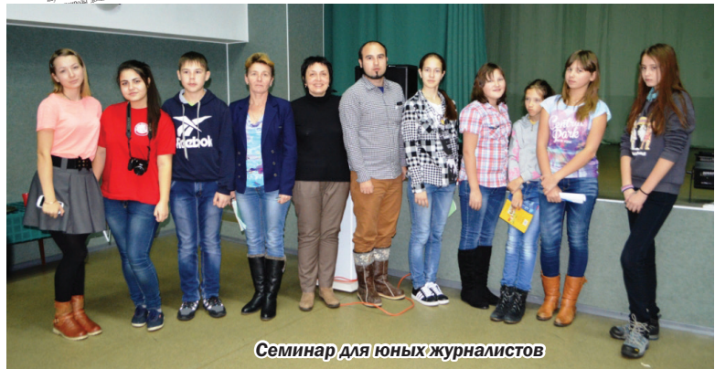
Семинар для юных журналистов