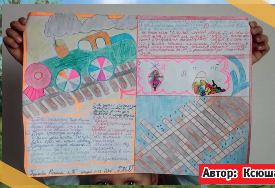
Автор: Ксюша Гудинова, 2 место