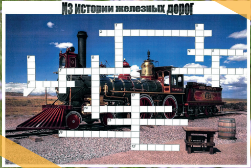
Автор: Н. Константинова