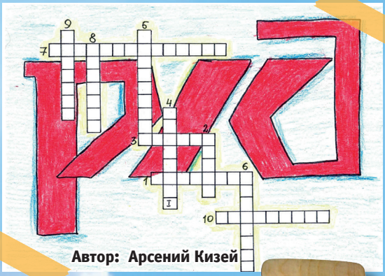
Автор: Арсений Кизей