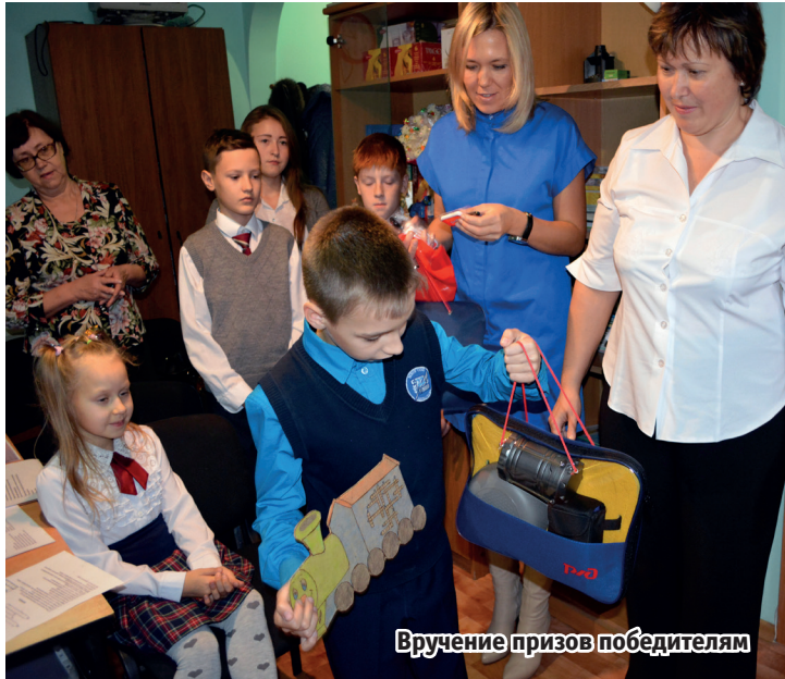
Вручение призов победителям

Еще раз поздравляем всех, принявших участие в конкурсе! Вы молодцы, что не поленились и пополнили свои копилочки знаний. Желаем и дальше оставаться такими же творческими, эрудированными и любознательными!