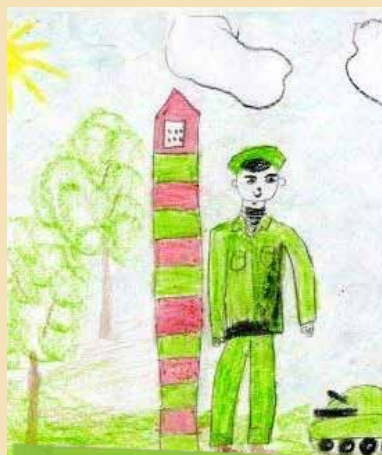
Макар Горохов, 6 лет.