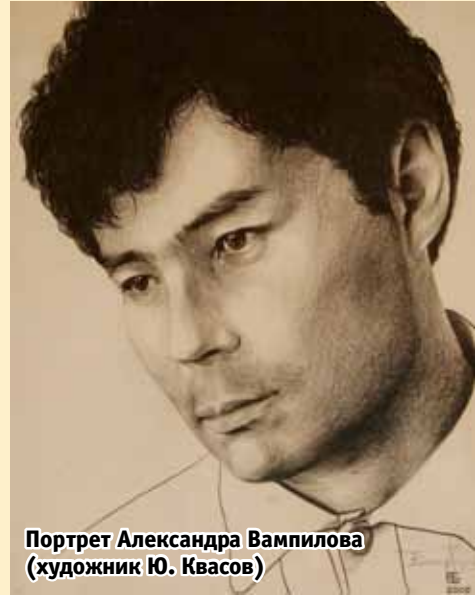
Портрет Александра Вампилова (художник Ю. Квасов)

В первые дни после окончания Литературного института им. Горького все выпускники в знак прощания со студенческой жизнью сжигали свои старые тетрадки, черновики. Один драматург из Грозного так разошелся,