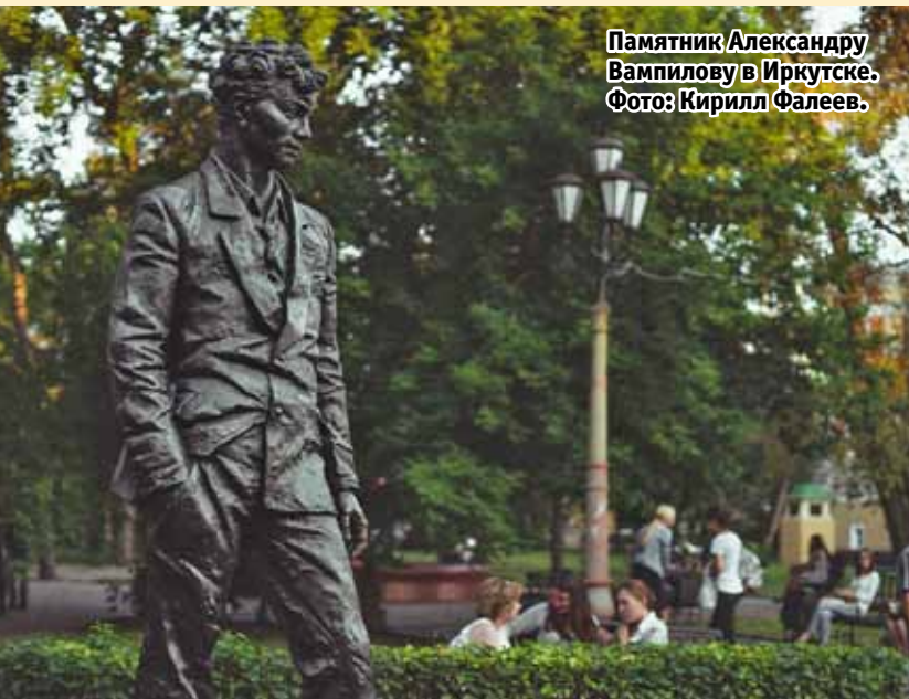
Памятник Александру Вампилову в Иркутске.